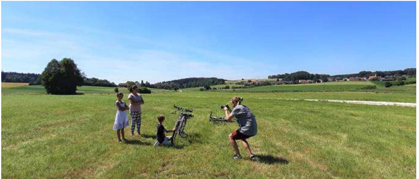
1 Huch, was da bloß geschehen sein mag? - Die Auflösung gibt es am 30. Januar!